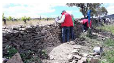
Association La Pierre Sèche Faugères

34600 FAUGERES Tél. +33 6 16 60 81 76 pierres.vie@gmail.com