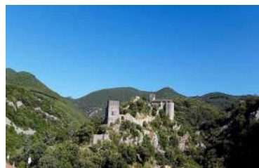
Histoire du midi