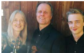
Haydn Trio 2021

Route de Gabian 34320 ROUJAN Tél. +33 4 67 24 52 45 info@chateau-cassan.com