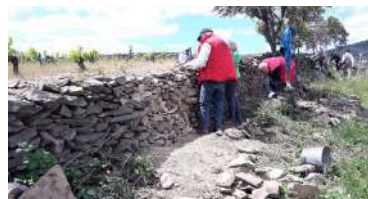
Association La Pierre Sèche Faugères

34600 FAUGERES Tél. +33 6 16 60 81 76 pierres.vie@gmail.com