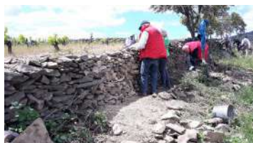
Association La Pierre Sèche Faugères